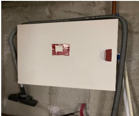
Brannslange i garasje